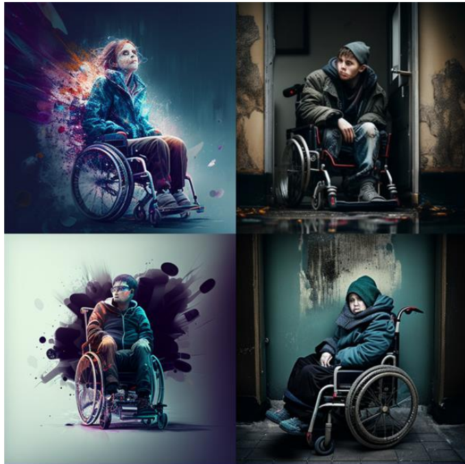
/imagine a disabled person