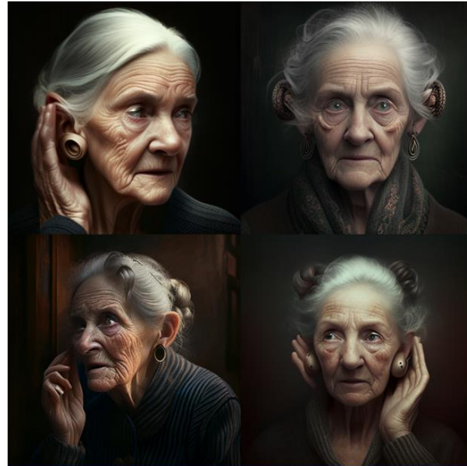
/imagine a deaf woman