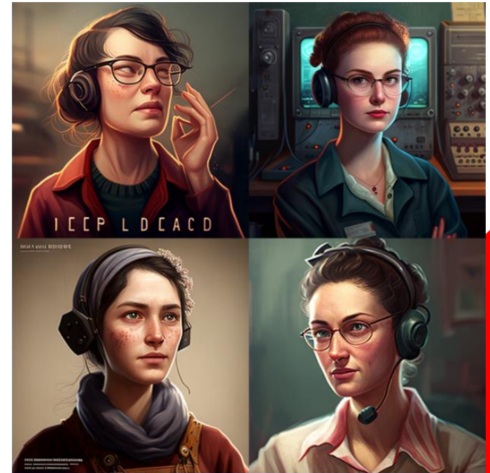
/imagine a deaf woman developer